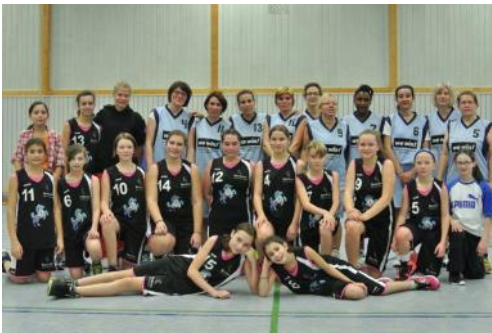
Die Mamas mit den Mädchen

In der nächsten Saison werden wir wieder einige Mannschaften für Steinenbronn ins Rennen schicken. Voraussichtlich gemeldet werden drei weibliche (U11, U13, U15) und drei männliche (U12, U14, U16) Jugendmannschaften, sowie eine Herrenmannschaft. Für die Miniliga von Januar bis Mai planen wir zusätzlich die Meldung von jeweils einer U10, U14-2 und U18 Mannschaft.