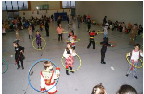
Wer kann's am längsten, Hula Hupp

Auch für die vielen erwachsenen Besucher war bestens gesorgt, die Helfer vom Sportverein sorgten für Getränke und Speisen aller Art. Wir bedanken uns bei den vielen Gästen für ihr Kommen und die super Stimmung und natürlich bei allen Helfern und Sponsoren der Fußballjugend ohne die der Kinderfasching in Steinenbronn kein so tolles Erlebnis wäre.