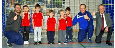
der Turniersieger, die Wichtel vom KIGA Plieningerstraße

Allen hat es viel Spaß gemacht und es wurde spontan entschieden, dass wir uns im Jahr 2016 wieder zum Kindergartenturnier treffen.