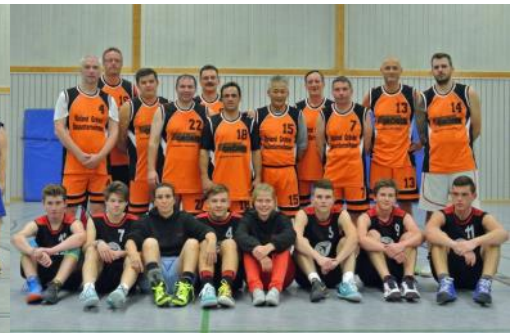
Die Papas mit den Jungs