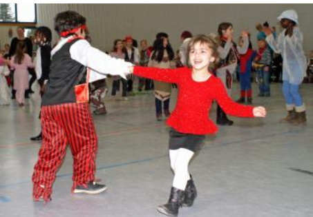
Strahlendes Lachen beim Tanz des Fliegerlieds