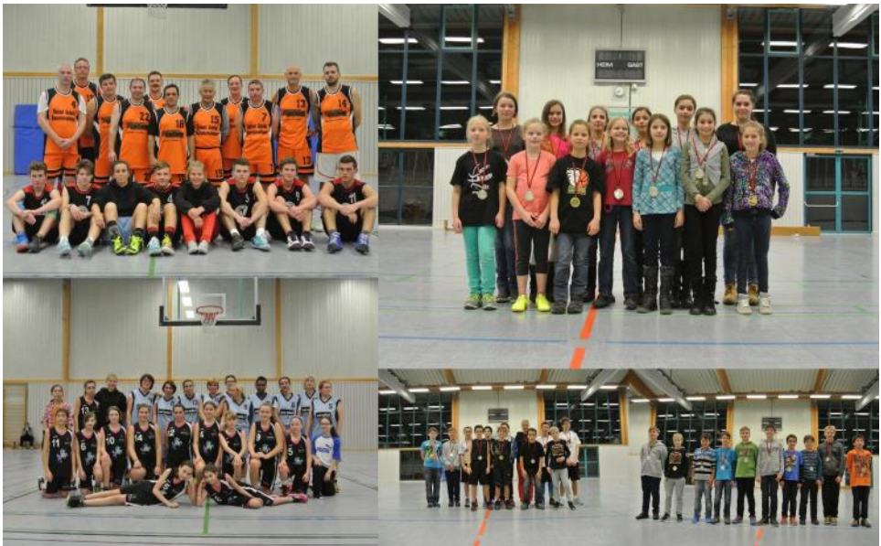
Wir feierten Weihnachten mit den Basketballern

Für 2015 laufen derzeit schon die Planungen für ein Sommerfest, das Camp zum Beginn der Saison und natürlich auch für eine Weihnachtsfeier!