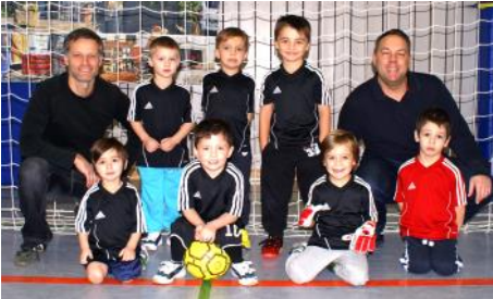
die Zwerge aus der Plieningerstraße

Belohnt wurde dies durch den Turniersieg der Wichtel und die Zwerge wurden punktgleich zweiter.