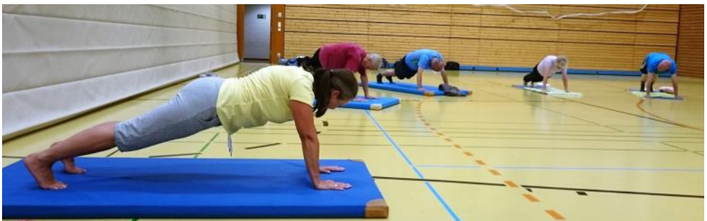
Der Liegestütz zur Kräftigung der Bauch- und Rückenmuskulatur

Sie haben Interesse? Dann kommen Sie einfach mal vorbei und schauen sich die Gymnastik an. Oder machen Sie am besten gleich mit; auch Ungeübte und Wiedereinsteiger können jederzeit beginnen und sind herzlich willkommen. Für weitere Informationen: Elisabeth Krauhausen, Trainer C und B-Prävention, Rückentrainer, Tel. 22882.