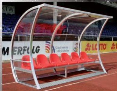
Spielerkabinen von 4-10 Personen

Trikottaschen und Spielertaschen in verschiedenen Farben