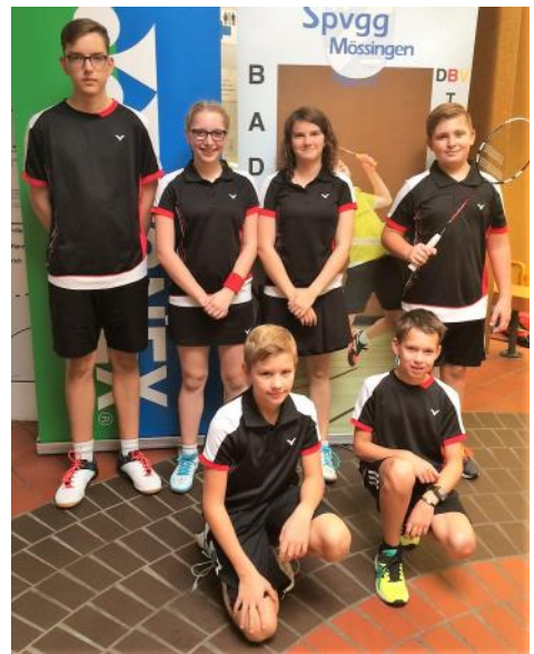
Jugend des TSV beim Turnier in Mössingen