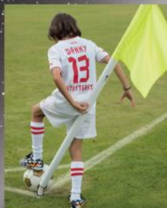
Eckfahnen mit Gelenk